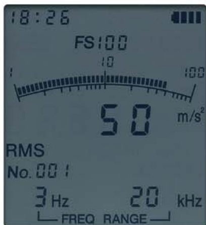
測定データの表示画面

液晶画面にはバークラフと数値が同時に表示され、変動の様子を容易に把握。設定した周波数範囲などの情報も表示し、バックライト機能により暗所でも内容を確認できます。オーバーロードの状態になると、OVERが表示され、液晶全体が赤色に変わります。