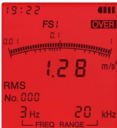
オーバーロード画面