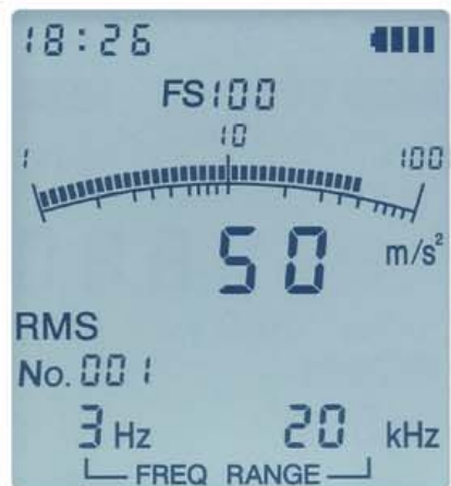
バックライトの点灯